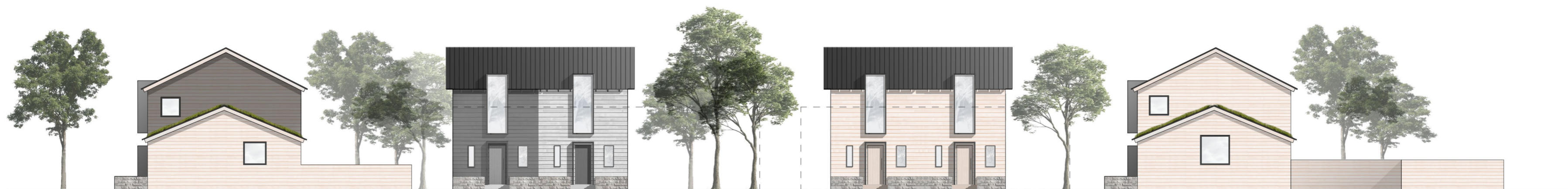
ALUEJULKISIVU LOUNAASEEN 1:200