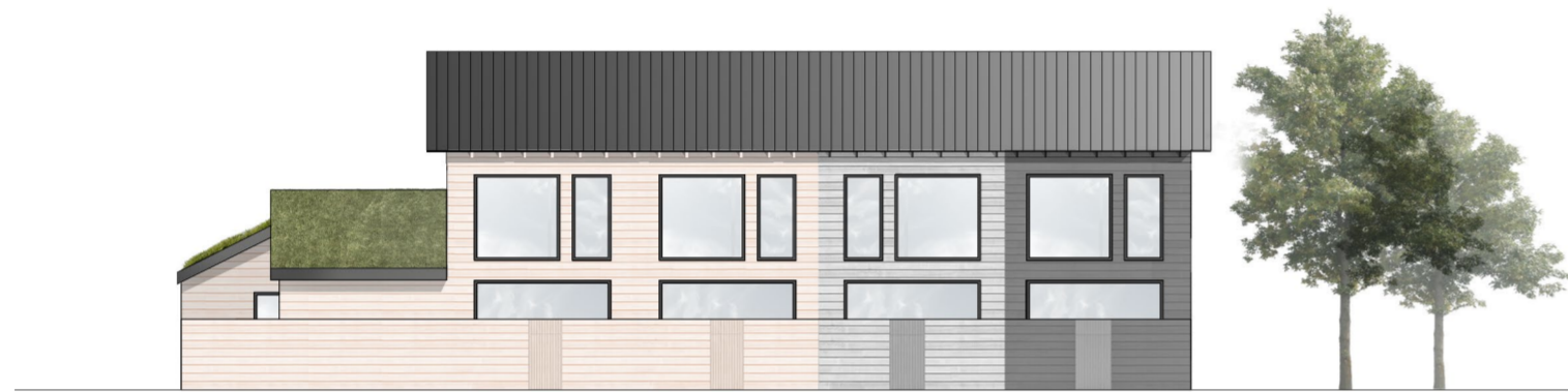
ALUEJULKISIVU KAAKKOON 1:200