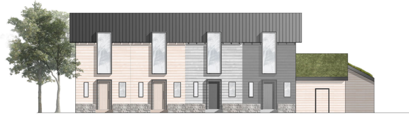
ALUEJULKISIVU LUOTEeseen 1:200