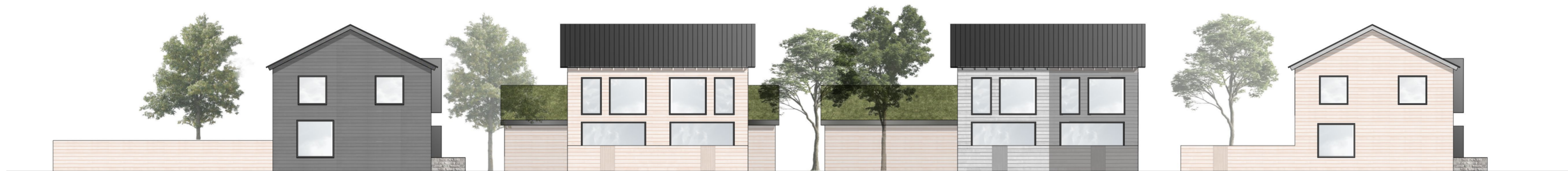
ALUEJULKISIVU KOILLISEEN 1:200